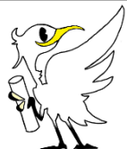
在家小マスコット キャラクター 「ザッピー」