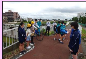
〈小中連携あいさつ運動〉