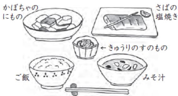
〈わが家の昨夜のこんだて〉