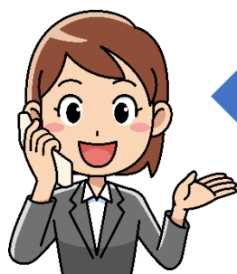
コールセンター (通訳者)